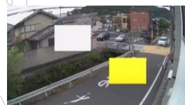
プライバシーマスク機能

カメラの映像内に近隣家屋や社内機密等、撮影してはならない箇所が映っている場合映像内に『目隠し』することでプライバシーに配慮します。(最大16箇所)