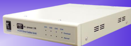
[ KE-PS114A ]