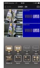
専用アプリ (SoCatch) 画面