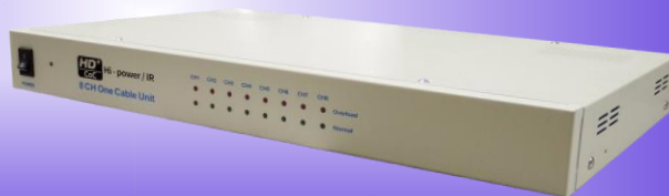
[ KE-PS118A ]