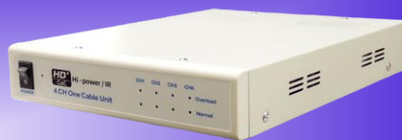
[ KE-PS114A ]