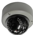
IR-LED内蔵ドームカメラ