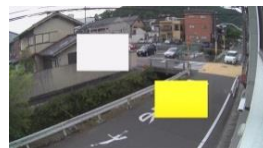
プライバシーマスク機能

カメラの映像内に人物や車両の動きがあった際、画面上に表示します。 任意の4箇所を検知エリアとして、設定を行います。