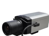
デイトライトカメラ

※ 電源重畳対応カメラと電源ユニットは、それぞれ専用の関係になります。 他メーカーの商品、及び電源重畳方式に対応していないカメラとの互換性はありません。 本製品は、AHDカメラ「KE-AHDシリーズ」の一部にのみ対応しています。 電源重畳に対応していないカメラと接続すると、故障および事故につながりますので、ご注意ください。 対応機器の詳細については、裏面の『カメラ適合機種』をご参照ください。