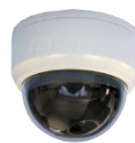
IR-LED内蔵 パンダルブルーフードームカメラ